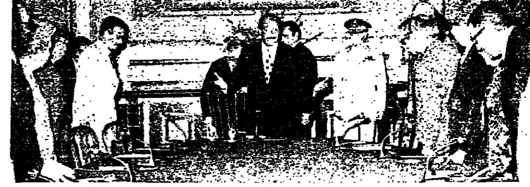
الرئيس السادات لدى اجتماعه امس الاول بالجلسة الاعلى للصحة